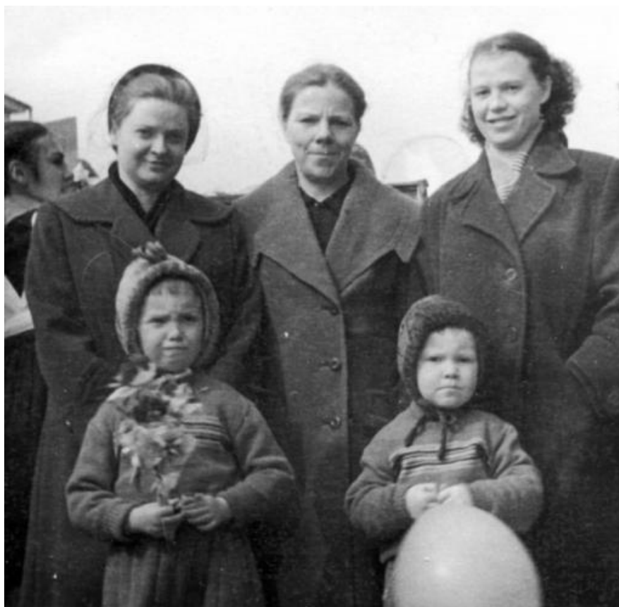
Наши учителя с детьми