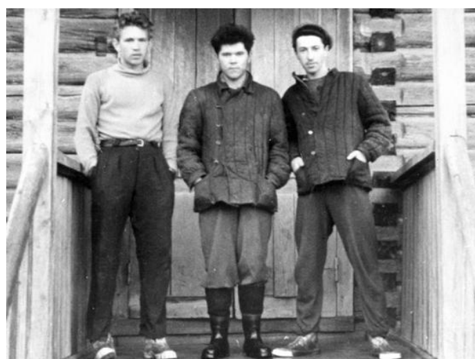
Сентябрь 1961 год. Дер. Алексино