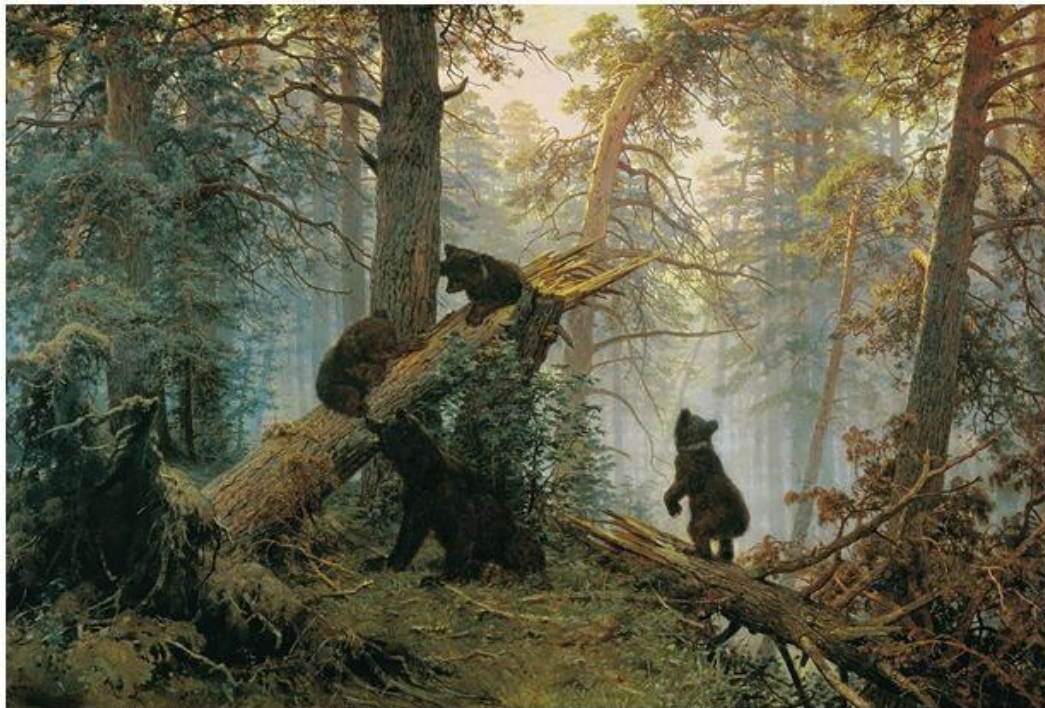
Утро в сосновом лесу

Наверное, тогда во многих семьях были ковры и прикроватные коврики с тремя медведями с картины «Утро в сосновом лесу». Картину полюбили за красоту природы.