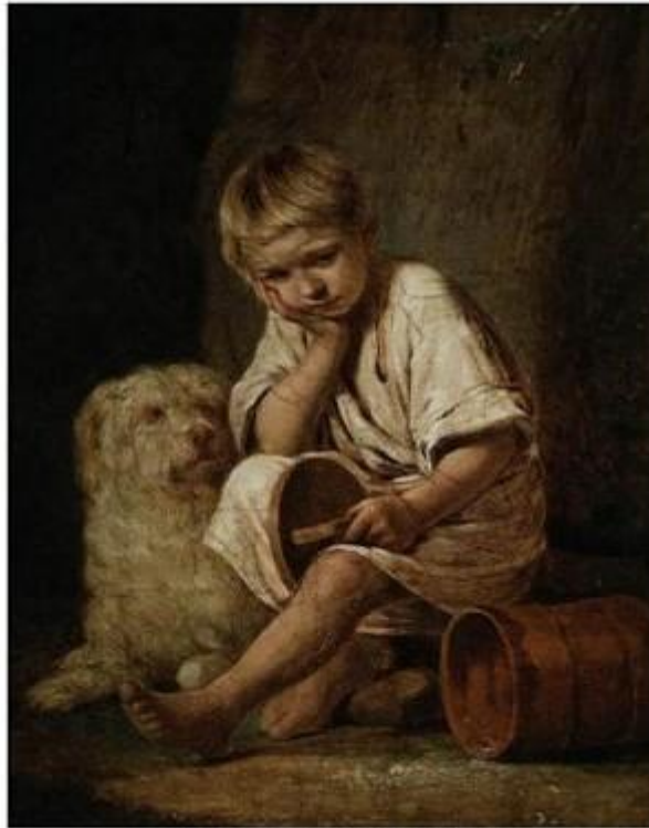
Вот-те и батькин обед!