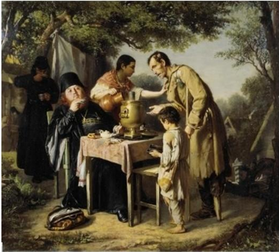
Чаепитие в Мытищах, близ Москвы