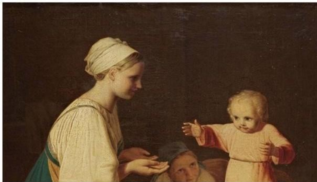
Первые шаги (крестьянка с ребенком)