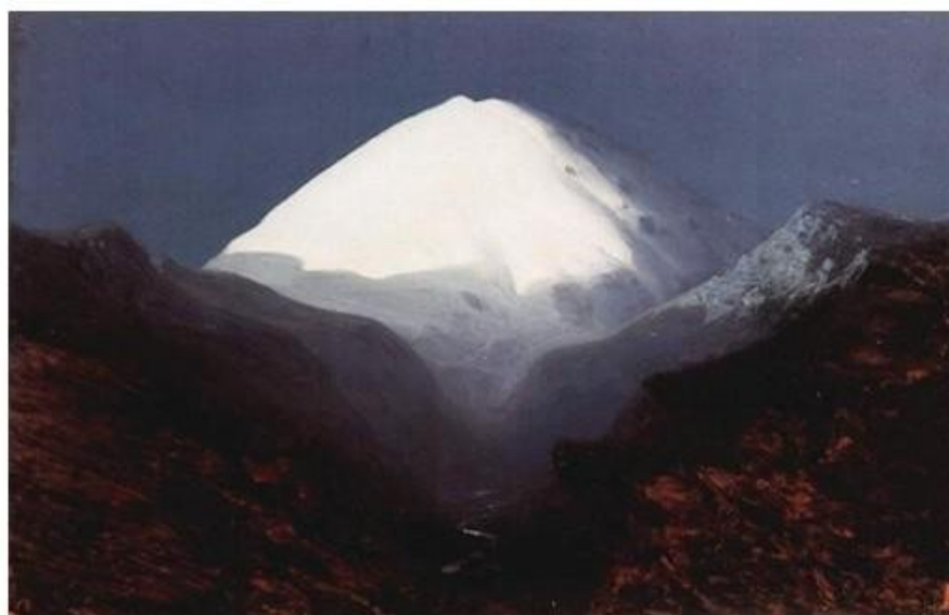
Эльбрус. Лунная ночь