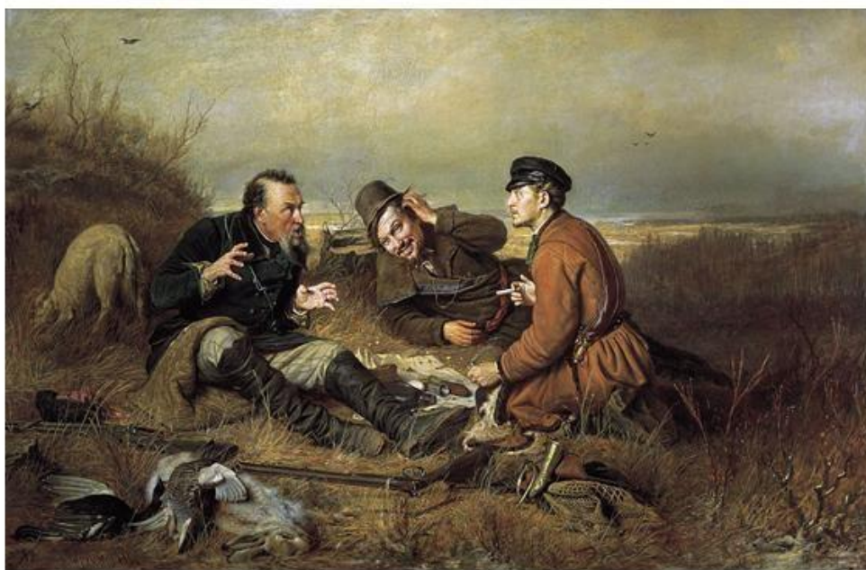
Охотники на привале