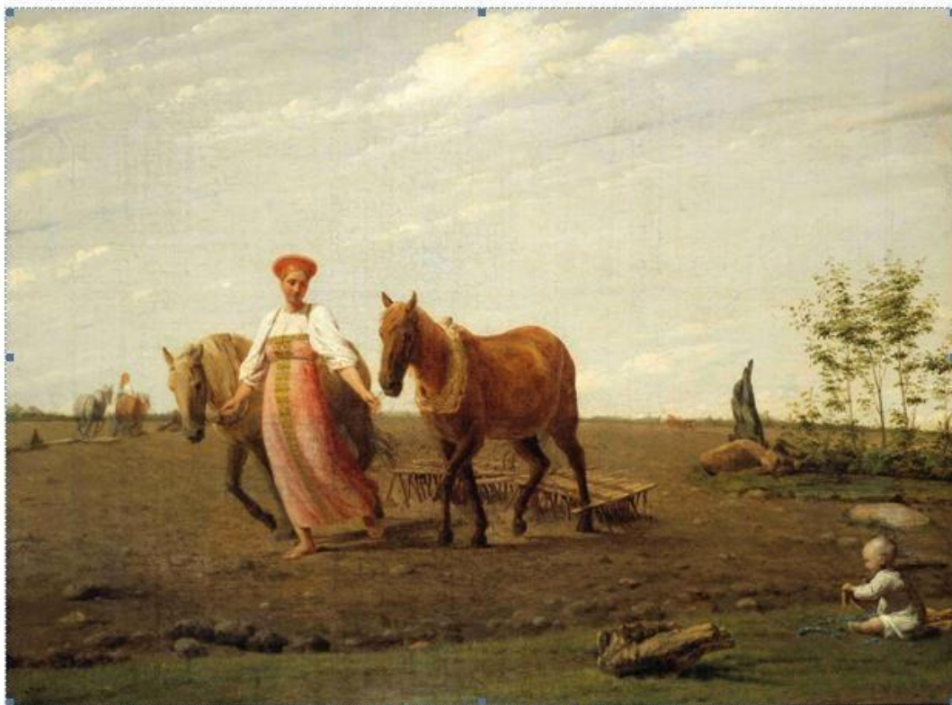
На пашне. Весна