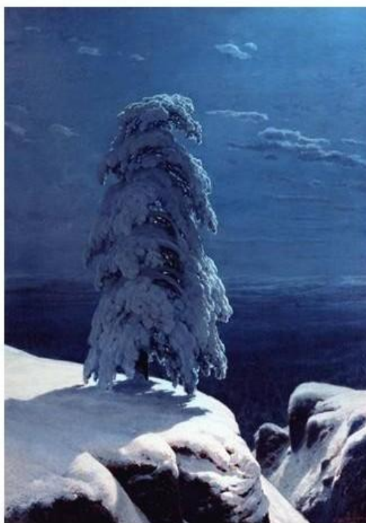
На севере диком

Картина «На севере диком» была написана художником как иллюстрация к стихотворению М.Ю. Лермонтова «На севере диком стоит одиноко...».