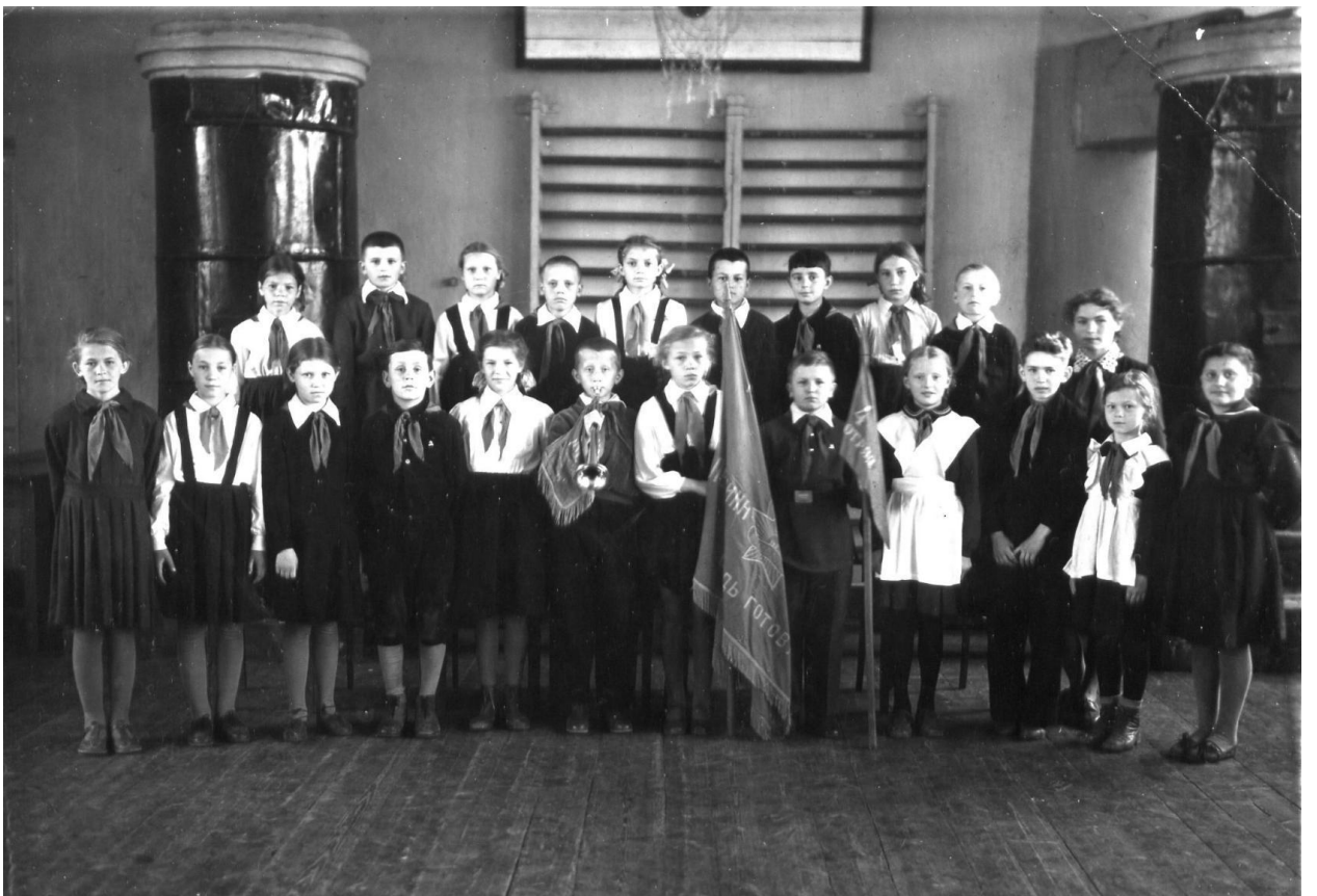
1956 г. 46 класс, ж/д школа №3 (76)