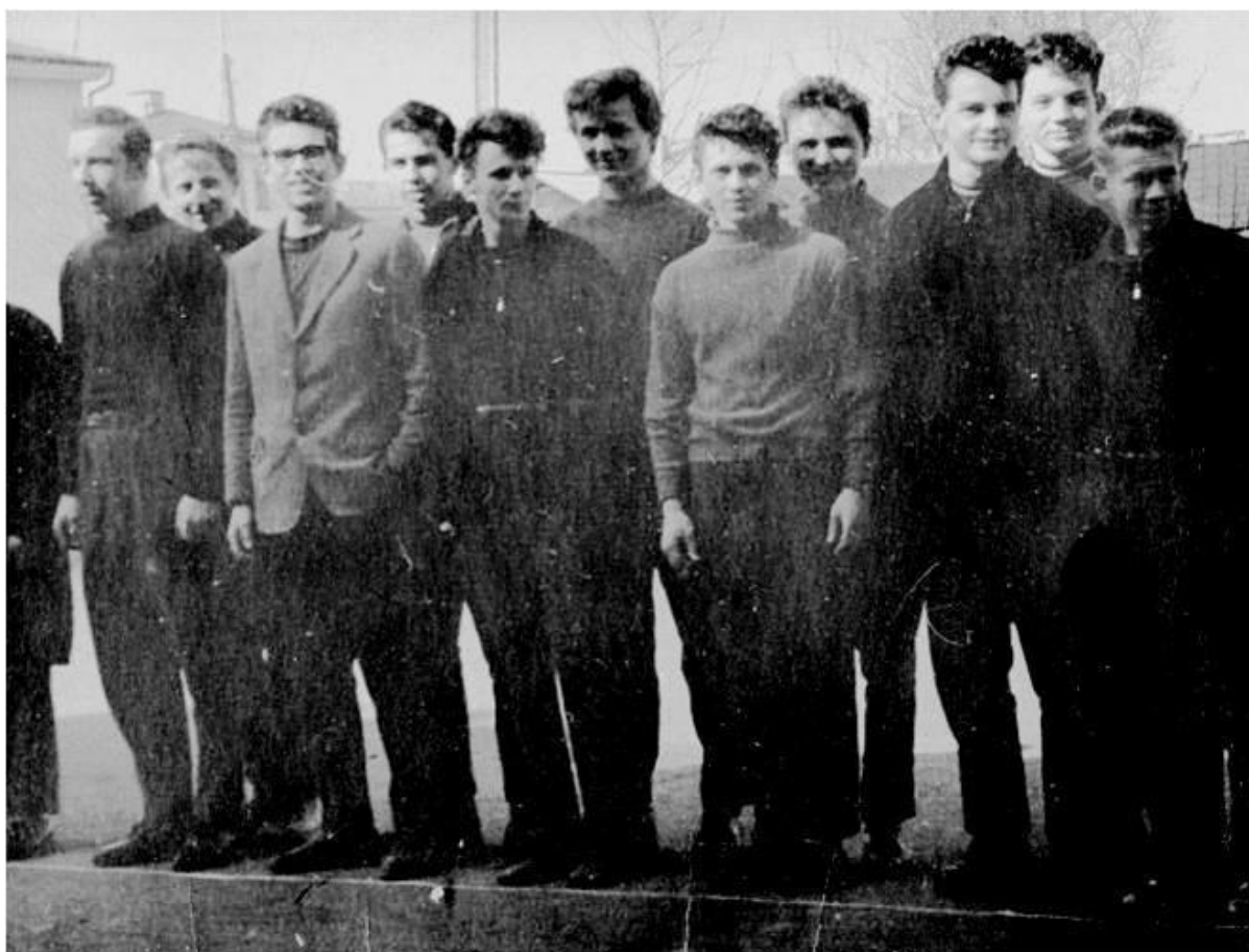
1962 г. На городских школьных соревнованиях