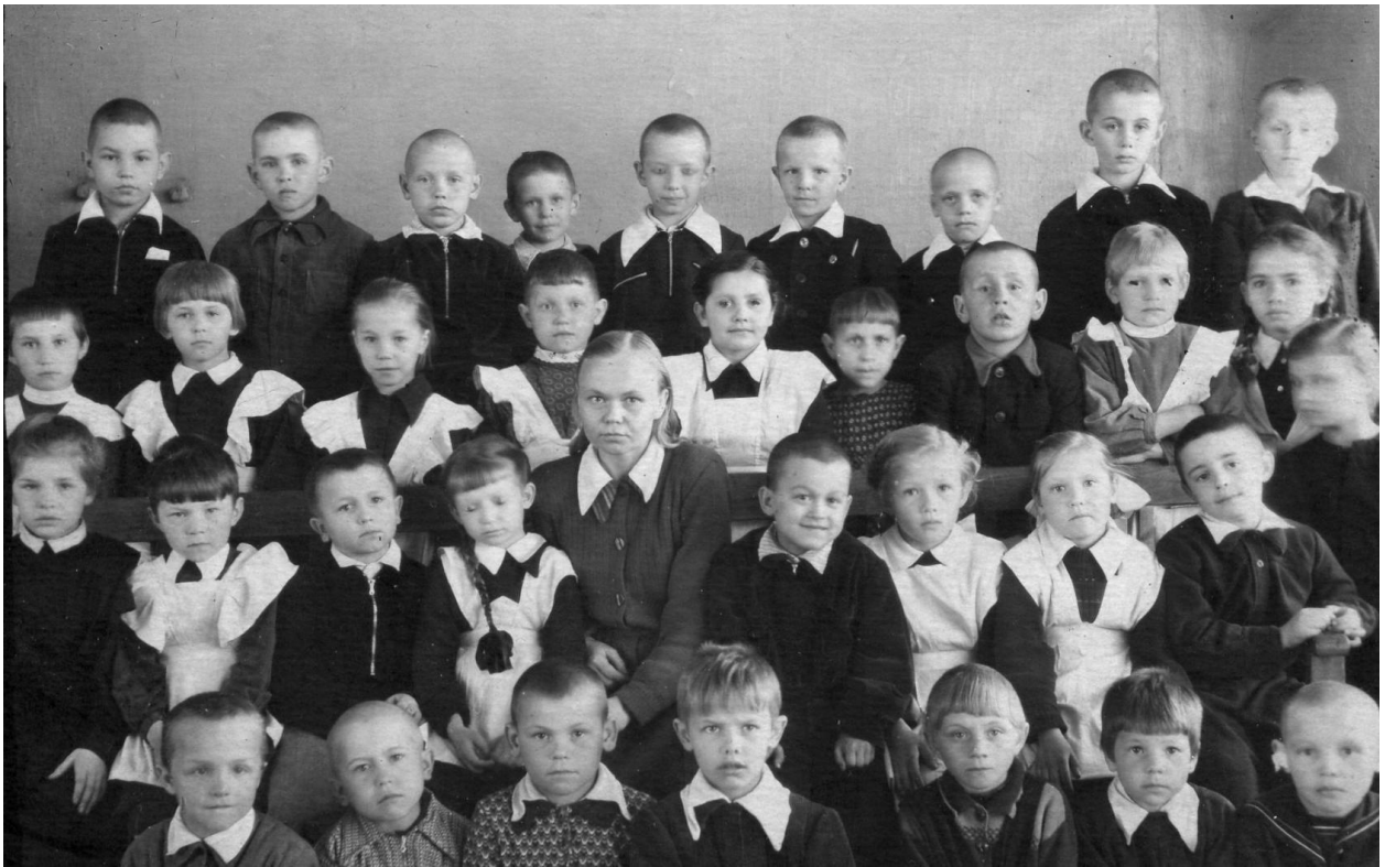
1953 г. 16 класс, ж/д школа №3 (76)