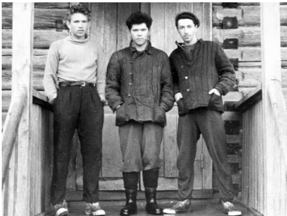
Сентябрь 1961 год. Дер. Алексино